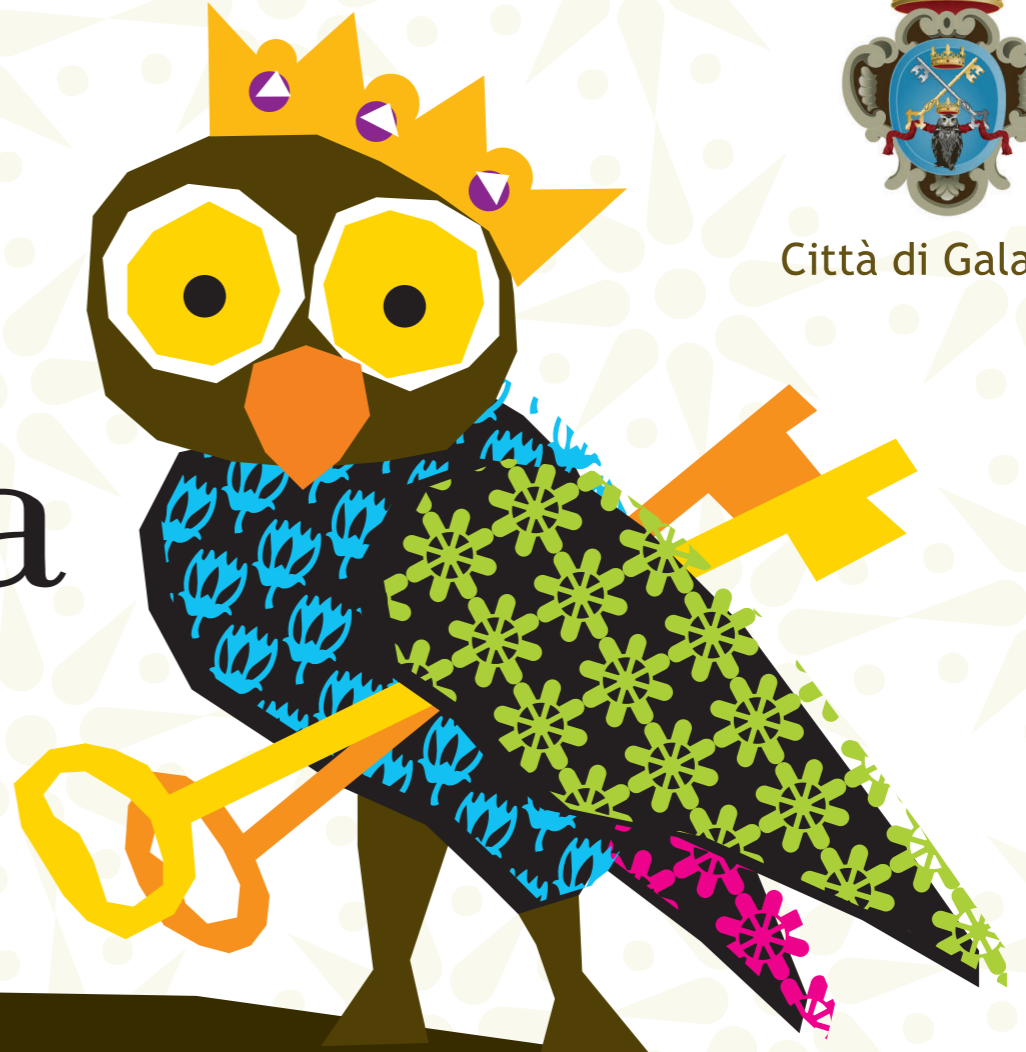
Illustrazione e grafica: valentina sanob

teatro | musica | laboratori | danza libri | cinema | comicità e satira giovani e sport | arte | storia