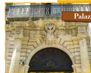
Palazzo S. Paolo